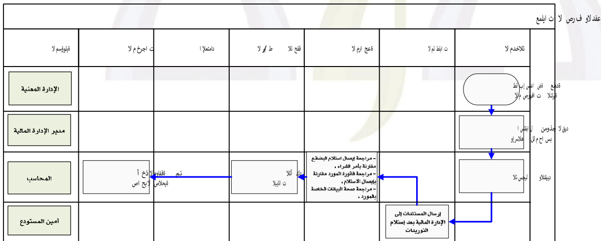
شكل رقم / ٨

يوضح المخطط البياني التالي (شكل رقم / ٨) طريقة تسلسل العمل للصرف والدفع: