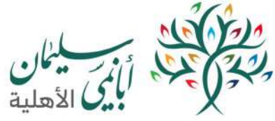
Sulaiman Abanumay Foundation